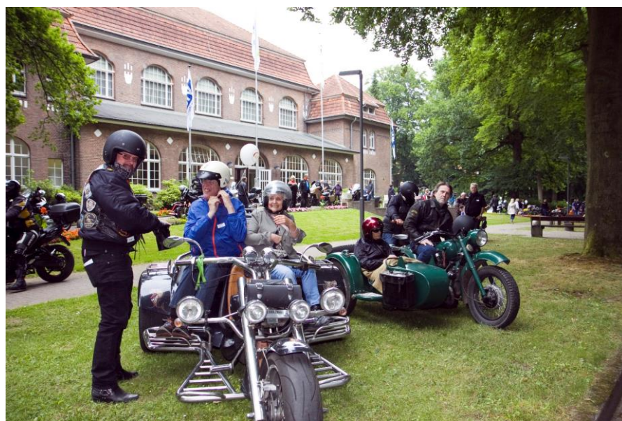
Foto: Zündkerzentreffen vor dem Gesellschaftshaus.jpg

Zündkerze über die gelungene Veranstaltung.